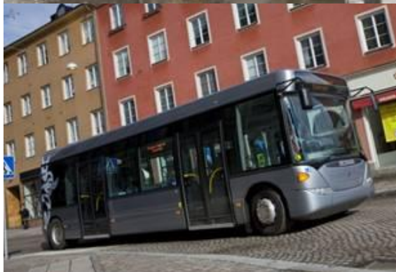
Bränsleförbrukning 5 l/h