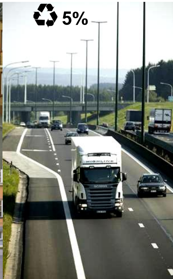
Bränsleförbrukning 25 l/h